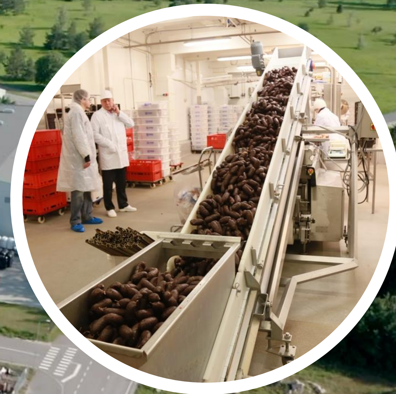
Rannarootsi Lihatööstus 175 töötajat