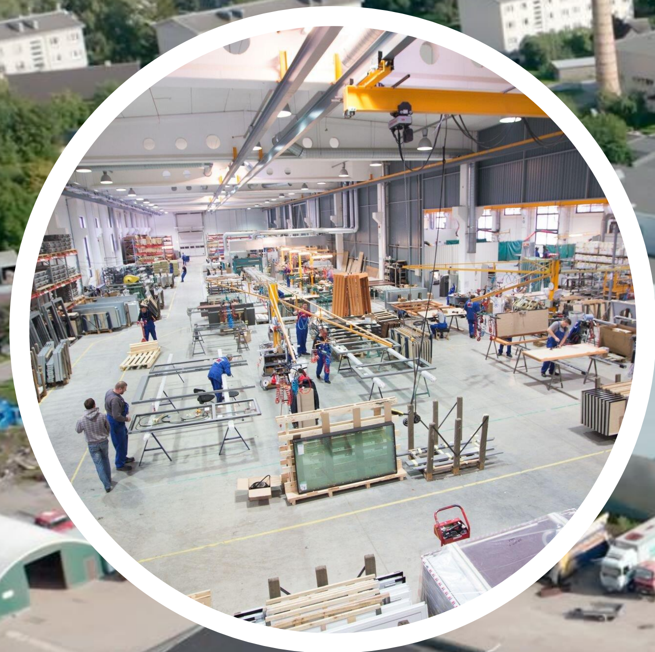
Haapsalu Uksetehas 167 töötajat

Läänemaa ettevõtlus arvudes, statistika Läänemaa ettevõtluse ülevaade